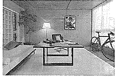
▲モデルルームもおしゃれ

「若い世代に対して単に格好良いデザインを施しただけでは入居に結びつかない。自分らしい住まいを求める世代には、キャンパスのようにあらゆる個性に対応できる物件の企画を生み出すことが重要」と経営企画室長は語る。