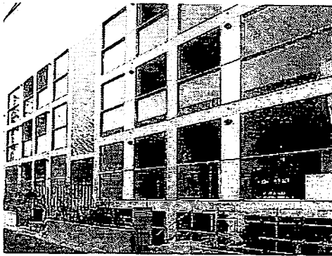
◀ガラス一面の外観